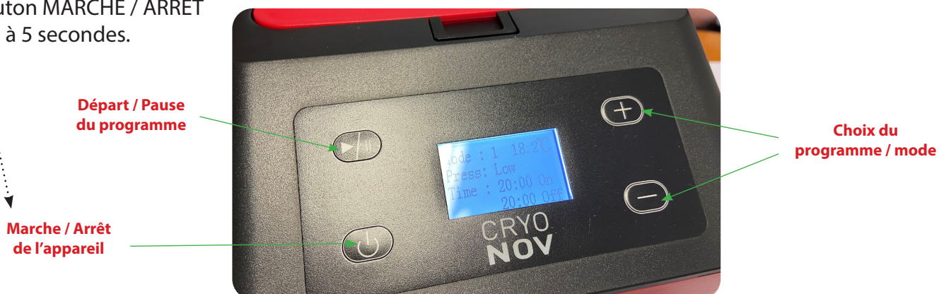
Tableau des traitements

Allumer l'appareil en appuyant sur le bouton MARCHÉ / ARRÉT environ 3 à 5 secondes.