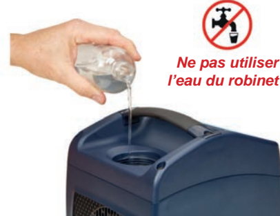
06 REMPLISSAGE 2

Utilisez la bouteille d'eau déminéralisée, qui est livrée avec l'appareil