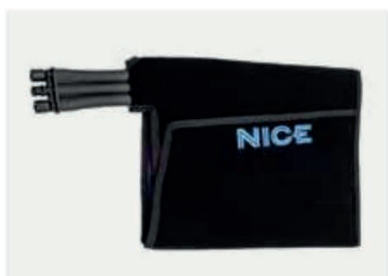
01 ENVELOPPEMENT DE GENOU