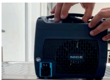
05 REMPLISSAGE 1

Une fois ajusté, l'écharpe doit être confortablement ajustée, sans plis