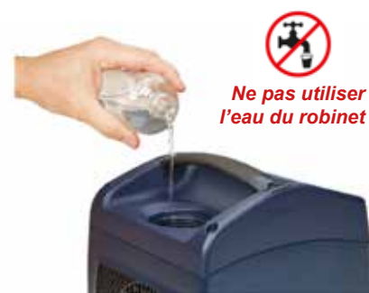
06 REMPLISSAGE 2

Dévissez le bouchon du réservoir sur le dessus de l'appareil et versez tout le contenu de la bouteille fournie, ou avec de l'eau de source minérale en bouteille.