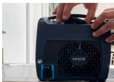
05 REMPLISSAGE 1